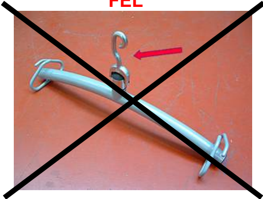
Berörd fästpunkt på bygel