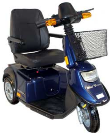
Mini Crosser T-modell