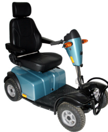
Mini Crosser E-modell, Nordic